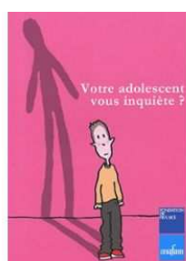
Votre adolescent vous inquiète? UNAFAM