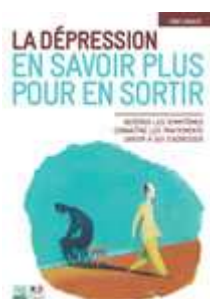
La dépression. En savoir plus pour en sortir. INPES