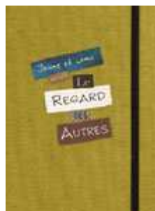
Jeune et homo sous le regard des autres.