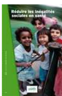
Réduire les inégalités sociales de santé. INPES