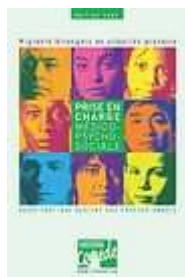
Prise en charge médico-psycho-sociale. COMEDE